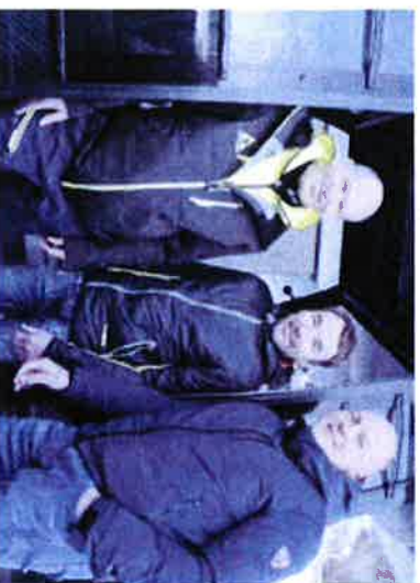
LÉGENDES La piste de l'Ours et ses stars du ski: Michael von Grütigen, Steve Locher et le Français Sébastien Amiez.